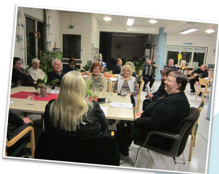
Yhteislauluillassa kevällä 2013