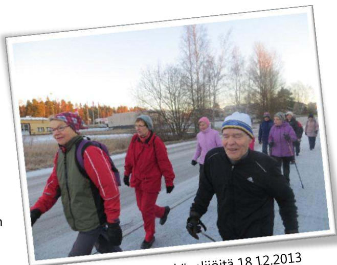
Raision nivelkerhon kävelijöitä 18.12.2013

Liikuntamahdollisuuksista tiedotettiin laajasti jäsenille. Liikuntaohjelmasta tiedotettiin Nivelposti-jäsenlehden lisäksi kotisivuilla, sanomalehdissä ja tapahtumakalentereissa. Alkuvuoden jäsenpostituksen yhteydessä kaikille jäsenille lähetettiin istumisen seurantakortti. Jäseniä kannustettiin omaehtoiseen liikuntaan myös jäseneduilla Turun Verkahovissa, Kylpylähotelli Caribiassa, Naantalın kylpylässä ja Ruissalon kylpylässä.