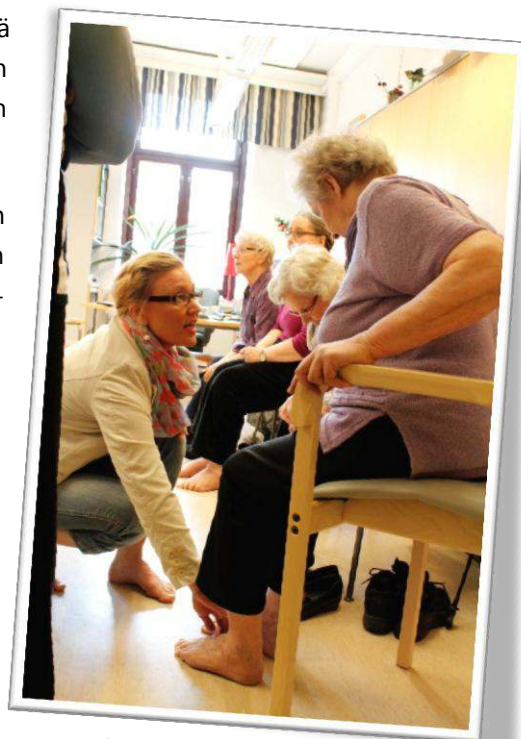
Jalkajumppaa nivelviikolla toimiston tiloissa

Yhdistyksen edustajia osallistui vuoden aikana useisiin yleisötapahtumiin, seminaareihin ja muihin tilaisuuksiin Turussa, Raisiossa, Liedossa, Sauvossa, Piikkiössä ja Kaari-nassa; esimerkiksi Killin markkinoille Raisiossa 25.8., Vapaaehtoistoiminnan messuille Turun Hansakeskuksessa 4.9., Senioritempaukseen Lietoon 12.9. ja Liedon Mikkelin markkinoille 29.9. Yhdistys oli mukana järjestämässä valtakunnallista Vapaaehtoistoiminnan koordinaattorei-den syysseminaaria, joka pidettiin Turussa 7.–8.11.